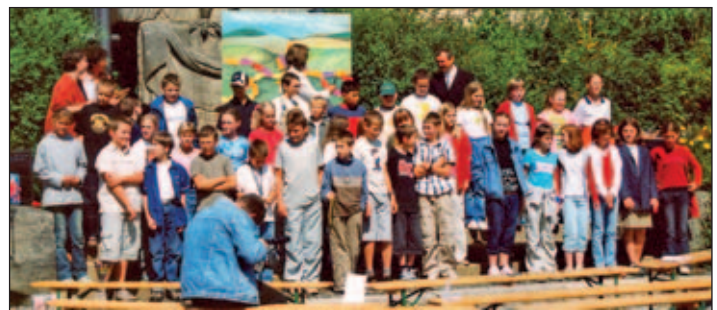
Unsere Schüler zum Schulstart im August 2004

Ein großes Dankeschön gilt immer wieder unserem engagierten und fleißigem Pädagogenteam.