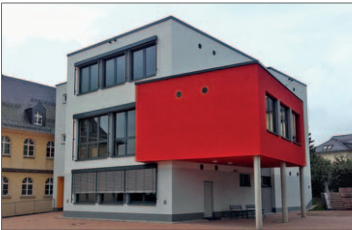
Unser neuer Anbau

An unserer Schule und in der Geschichte des Ökumenischen Schulvereines war es aber ein ganz besonderer Meilenstein. Pünktlich zum Beginn des neuen Schuljahres konnten fast alle Klassenzimmer im neuen Anbau von den Schülern und Lehrern in Beschlag genommen werden.