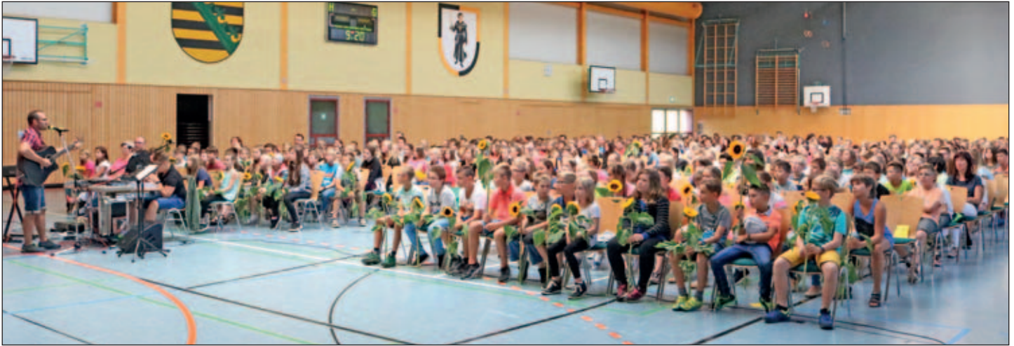
Andacht zum Schuljahresbeginn 2017

Am 07.08.2017 begann in unserer Evangelischen Oberschule Burkhardtsdorf (EOB) das neue Schuljahr mit einer Andacht in der Eurofoam arena. Eigentlich nichts Aufregendes, irgendwann gehen ja die Ferien einmal zu Ende und der Unterricht beginnt wieder.