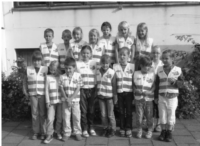
Klasse 1 der Grundschule Burkhardtsdorf