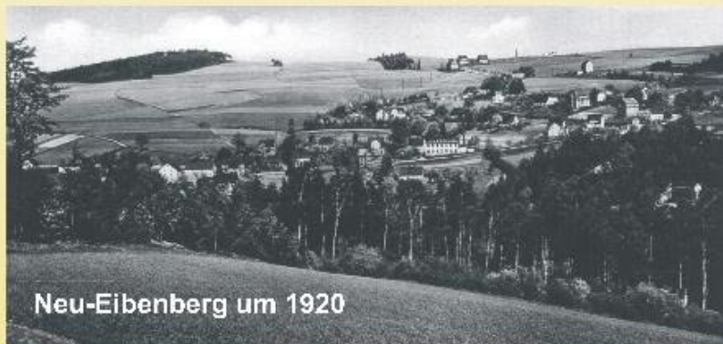
Neu-Eibenberg um 1920