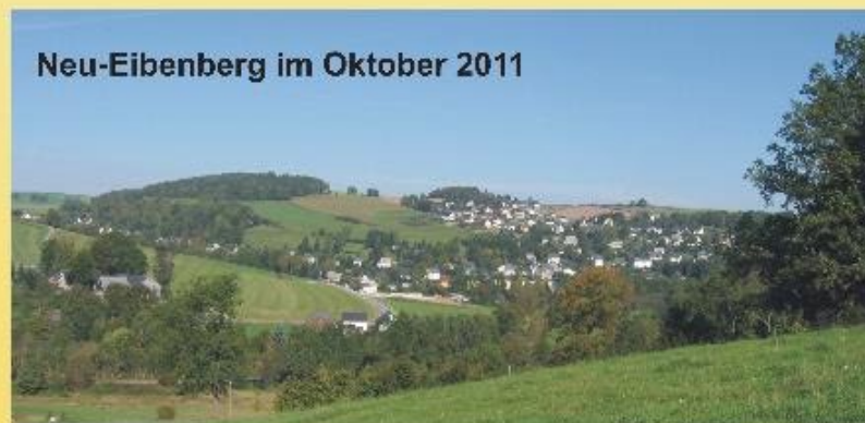
Neu-Eibenberg im Oktober 2011

Die Gruppe “Ortsgeschichte” im Heimatverein Kemtau / Eibenberg lädt am 12. und 13. November zur siebenten Ausstellung in das Gemeinschaftszentrum “Alte Schule” nach Eibenberg ein