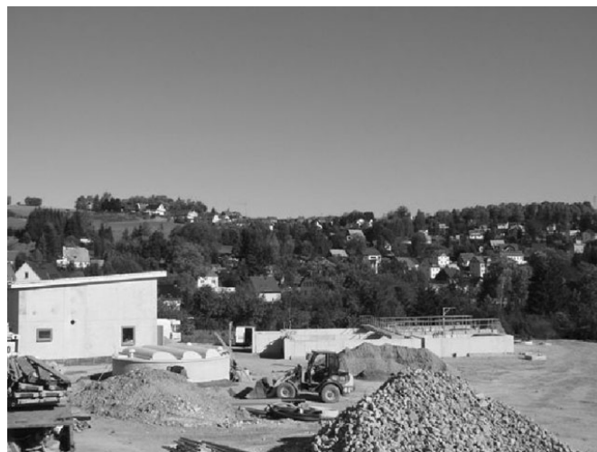
Kläranlage Burkhardtsdorf, 06.10.2011

Der Neubau der Kläranlage Burkhardtsdorf nimmt zusehend Gestalt an. Die Ausrüstung des Kompaktbeckens ist abgeschlossen. Zurzeit erfolgt die Ausrüstung des Betriebsgebäudes und die Gestaltung der Außenanlagen (Erdarbeiten und Einbau des Frostschutzmaterials). Der Probetrieb ist für Anfang November 2011 geplant.