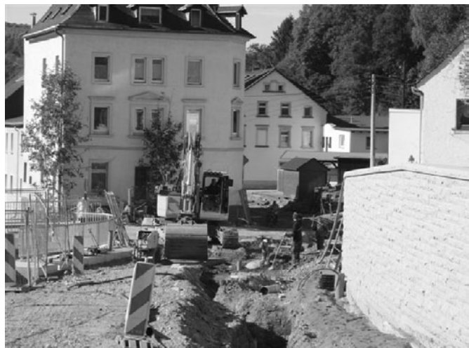
Kanalarbeiten B 180, 06.10.2011

Die Straßenbauarbeiten sind aus Richtung Kemtau kommend bis zur Eibenberger Straße 8 (bis auf Restarbeiten am Fußweg) abgeschlossen. Die Stützwände und Bauwerke sind auf dem Teilabschnitt fertiggestellt. Der Kanalbau des ZWW wird im Oktober beendet. Die Baumaßnahme wird voraussichtlich bis November 2011 andauern.