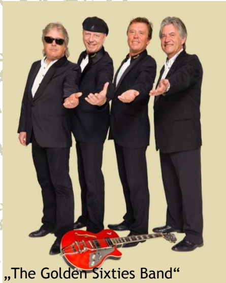
„The Golden Sixties Band“