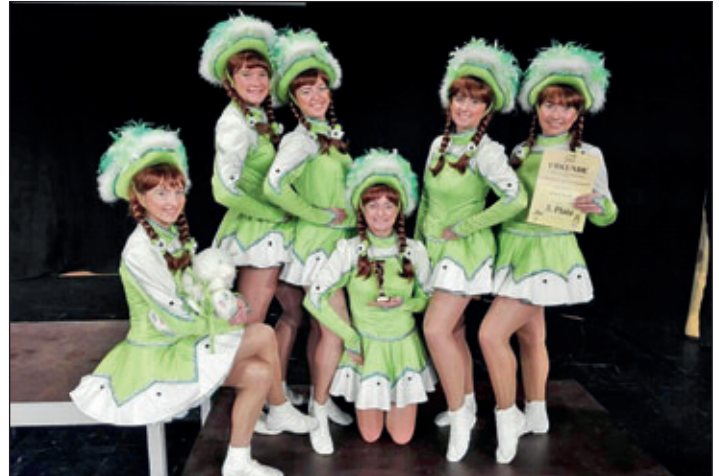
Funkengarde des BCA e. V..