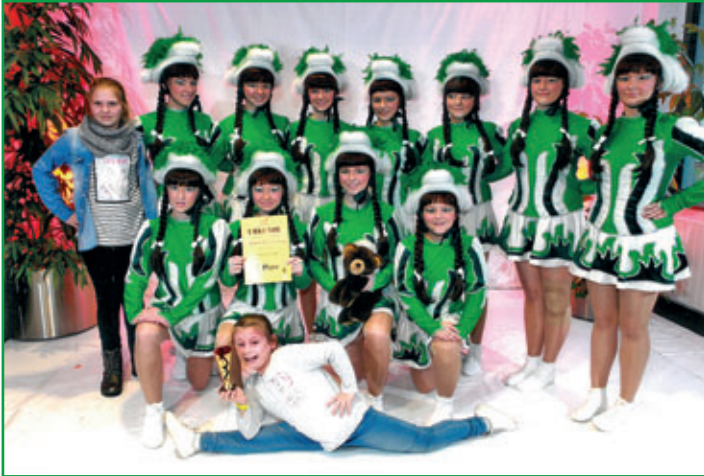
Juniorengarde des BCA e. V.

Unsere große Funkengarde legte nach und erkämpfte sich mit 414 von 500 möglichen Punkten einen genauso tollen 3. Platz! Ein Unterschied im Streichwert von 2 Punkten zum Zweitplatzierten machte hier die Platzierung aus.