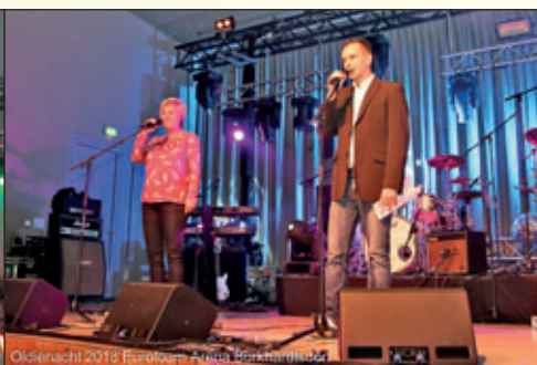
Oldienacht 2018 Eurofoam Arena Burkhardtsdorf