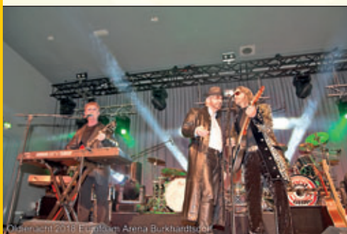
Oldienacht 2018 Eurofoam Arena Burkhardtsdorf