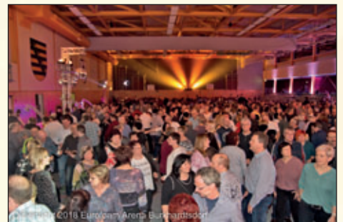
Oldienacht 2018 Eurofoam Arena Burkhardtsdorf