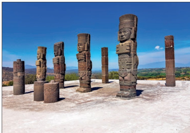
Die Basaltfiguren auf der Plattform der Atlanten des Morgenstern-Tempels in Tula