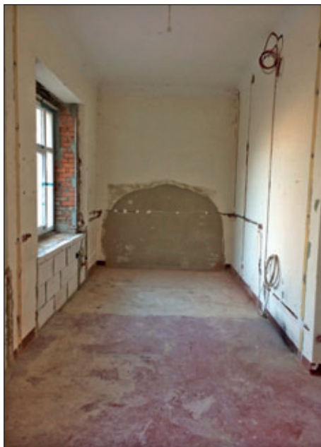
die zukünftige Küche