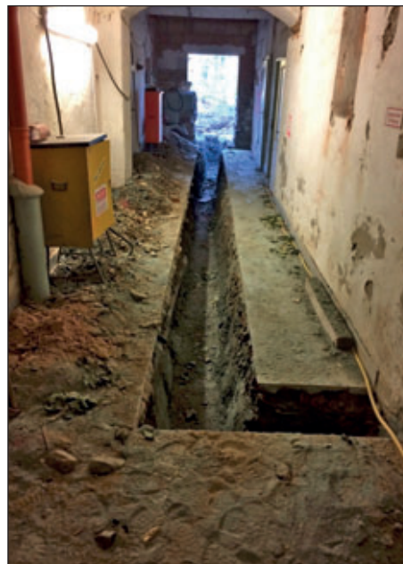
Graben im Keller