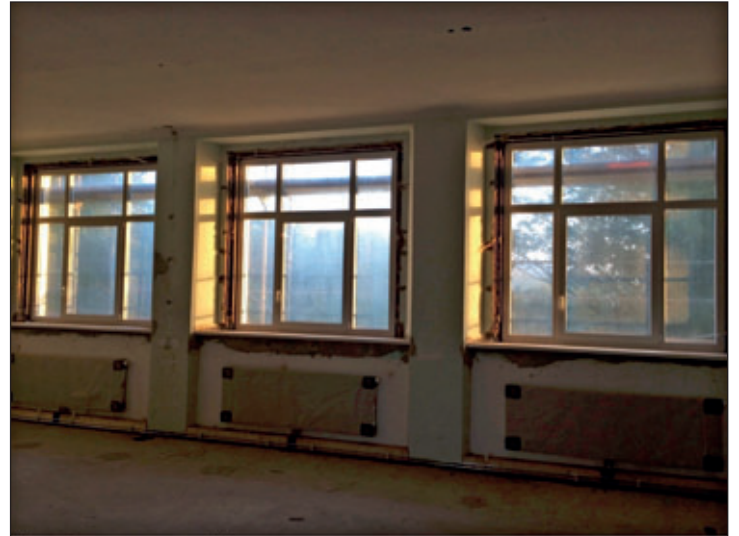
Einbau der neuen Fenster erfolgte