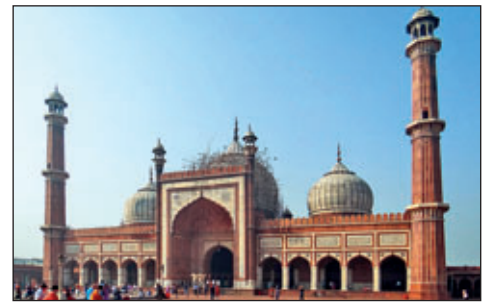
Freitagmoschee in Dehli

Im Nordwesten des Landes befindet sich die Wüste Thar. Zwischen der Wüste und