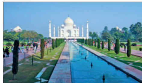
Taj Mahal in Agra

1970er Jahren auch die letzten Privilegien abgeschafft. Die Paläste und Festungen, heute anspruchsvolle Hotels, erinnern an die vielen Königreiche, die einst die Vorherrschaft in der Region hatten.