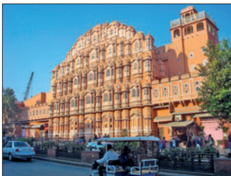
Palast der Winde in Jaipur

Wir waren zwei Wochen im Land der Maharajas unterwegs. Radjasthan ist mit ca. 350 Tausend Quadratkilometern der flächengrößte Bundesstaat und nur wenig kleiner als Deutschland. Er liegt im Norden Indiens, an der Grenze zu Pakistan. Die Hauptstadt dieses Bundesstaates ist Jaipur, die auch rosafarbene Stadt genannt wird. Die Reise beginnt am Tor zu Indien, der Hauptstadt Delhi. Von hier geht die Fahrt in westliche Richtung. Die wichtigsten, bekanntesten