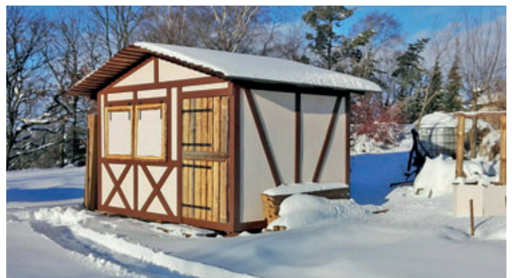
Die erste Hütte des Mittelalter-Dorfs ist längst fertig. Sie wird künftig im Burggraben stehen (Stand: Februar 2019).

Augustusburg/Scharfenstein/Lichtenwalde Schlossbetriebe gGmbH Marleen Dietz 09573 Augustusburg E-Mail: marleen.dietz@die-sehenswerten-drei.de