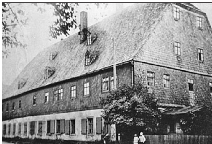
das Wohnhaus mit eingebautem Zuchtviehstall