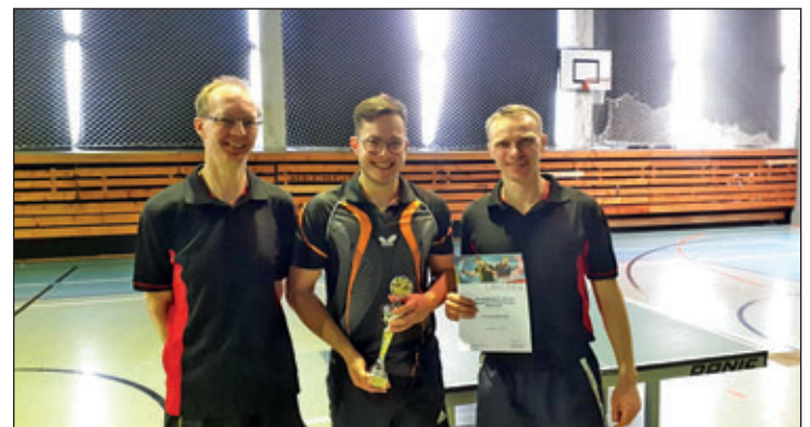
Text und Fotos: Ronny Reichel

Bei der in Döbeln ausgetragenen Landesendrunde der Kreispokalsieger belegte Burkhardtsdorf den 3. Platz.