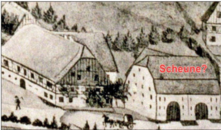
die Scheune rechts des Wohnhauses, sie soll am 01.11.1889 abgebrannt sein

„Die Scheune des Lehngerichts, ganz steinern erbaut, hatte ihren Platz an der Straße hin bis dicht zum Gasthof 'Zur Sonne'“.