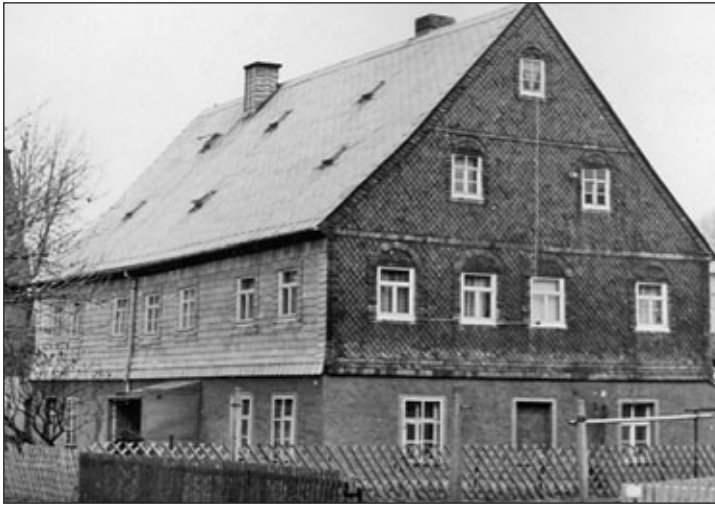
das Wohn- und Schuppengebäude dem Wohnhause gegenüber

Vom vierten Gebäude existiert kein Foto, aber es wird wie nachfolgend beschrieben: