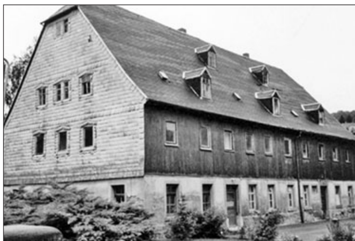
das Pferdestallgebäude links des Wohnhauses