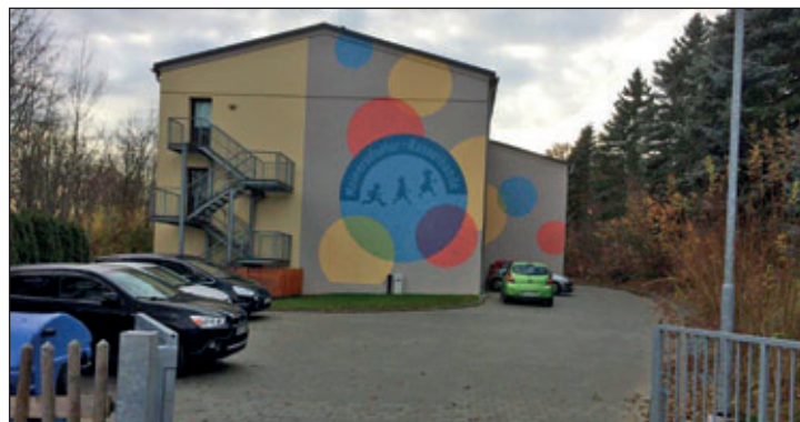
Kita „Meinersdorfer Rasselbande“

Der Ausbau und die Erweiterung des Außengeländes der Kita „Meinersdorfer Rasselbande“ in Burkhardtsdorf, OT Meinersdorf ist beendet. Vorhabens-trägerin ist die Gemeinde Burkhardtsdorf. Die Säch-sische Aufbaubank bewilligte als Projektförderung zur Anteilfinanzierung 75 % der zuwendungsfähigen Ausgaben aus dem Programm „Brücken in die Zukunft“.