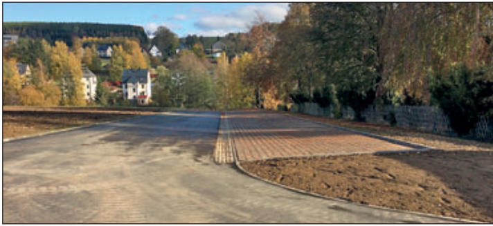
Parkplatz oberhalb des Friedhofs, Adorfer Straße

Mit der Pauschale zur Stärkung des ländlichen Raumes im Freistaat Sachsen hat die Gemeinde einen Parkplatz an der Adorfer Straße für die Besucher des Friedhofes Burkhardtsdorf errichtet.