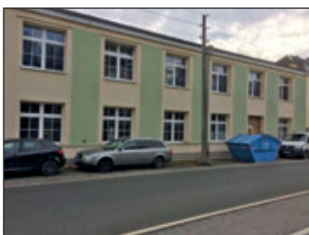
...hinter diesen Mauern wird fleißig gearbeitet

Der Umbau der zur Zeit leerstehenden Räume im Erdgeschoss der Kindertagesstätte „Löwenzahn“ für die Erweiterung des Krippenbereiches auf 30 Krippenplätze sowie Nachrüstungen hinsichtlich Brandschutz, Erneuerung der Elektroanlage, der Innentüren und Fußböden, Anpassungen an der Heizungsanlage, bedarfsgerechter Umbau der Sanitärbereiche, Einbau von mobilen Trennwänden und Erweiterung des Außengeländes ist in vollem Gange.