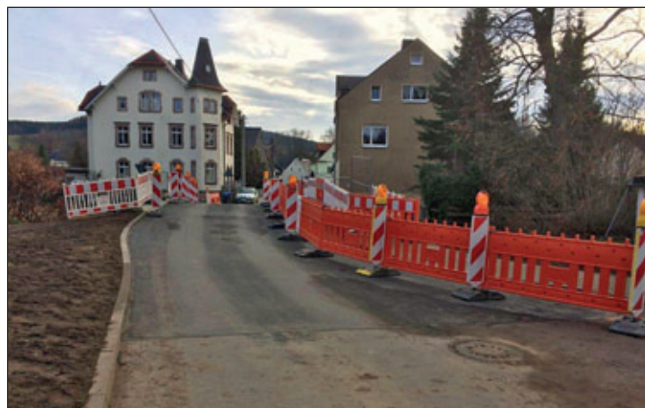
Brücke Alte Poststraße

Die Baumaßnahme „Ersatzneubau der Brücke Alte Poststraße und der Stützmauer im Brückenbereich“ – ebenfalls eine Maßnahme der Hochwasserschadensbeseitigung aus dem Jahr 2013 – befindet sich in den letzten Zügen. Die Bauzeit dauerte sechs Monate. Die feierliche Einweihung fand vor der Gemeinderatssitzung am 16.12.2019 statt.