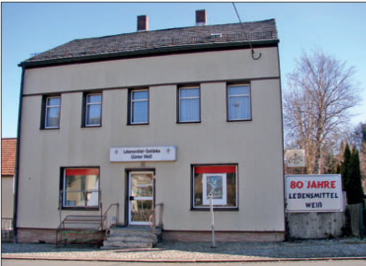
ehem. Wohn- und Geschäftshaus, Obere Hauptstraße 21

Aufgrund des Landesprogramms „Brachflächenrevitalisierung“ erhielt die Gemeinde Fördermittel für den Abbruch des ehemaligen Wohn- und Geschäftshauses Obere Hauptstraße 21. Der Auftrag wurde durch den Gemeinderat erteilt. Das Grundstück wird nach Beseitigung der baulichen Anlagen begrünt.