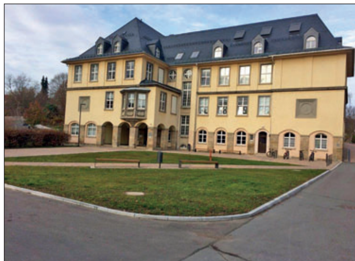
neuer Vorplatz der EOB

Der Vorplatz der Evangelischen Oberschule ist hergerichtet worden. Es fehlt nun noch ein Hingucker: ein Kunstobjekt als Bogen ausgeführt. Der Auftrag wurde an eine ortsansässige Firma vergeben und wird nun hergestellt. Der Aufbau soll Anfang 2020 erfolgen. Seien Sie gespannt!