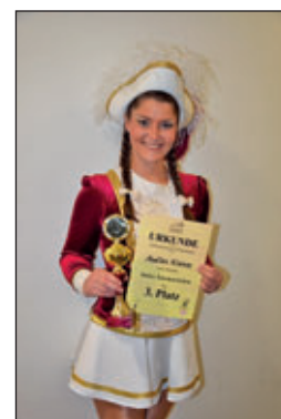
Juniorengarde des BCA e. V.