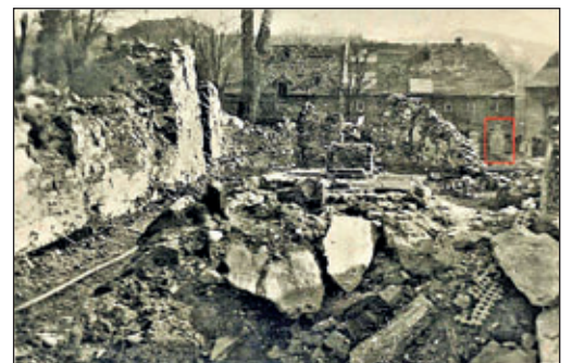
Kirchrüine kurz nach der Bombardierung

Vor einigen Jahren, bei der Restaurierung des Giebels der Harzer-Scheune stellte man noch Beschädigungen an den Balken fest. An anderen Stellen des Ortes, wie bei Schachtarbeiten für die „Vogelsiedlung“ oder am Eckhardt-Teich wurden nach Jahrzehnten noch Brandbomben gefunden. Zeitzeugen, die über die Auswirkungen von Kriegen berichten können, gibt es bald keine mehr. Trotzdem ist es wichtig, dass die leidvollen Erinnerungen auch nach 75 Jahren bewahrt werden!