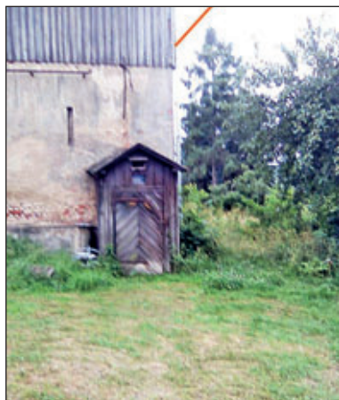
die orange Linie zeigt den restaurierten Giebel, das Vorhäuschen war der Eingang zum Schutzraum

(Burkhardtsdorf, Dezember 2019/Januar 2020, ausführliche Berichte in „Dunkle Wolken über Burkhardtsdorf“) Siegrun Weigelt