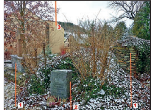
Blick zur Kirchrüine (1), zum Gedenkstein (2) und zur Kurt-Richter-Schule (3)

(Burkhardtsdorf, Dezember 2019/Januar 2020, ausführliche Berichte in „Dunkle Wolken über Burkhardtsdorf“) Siegrun Weigelt