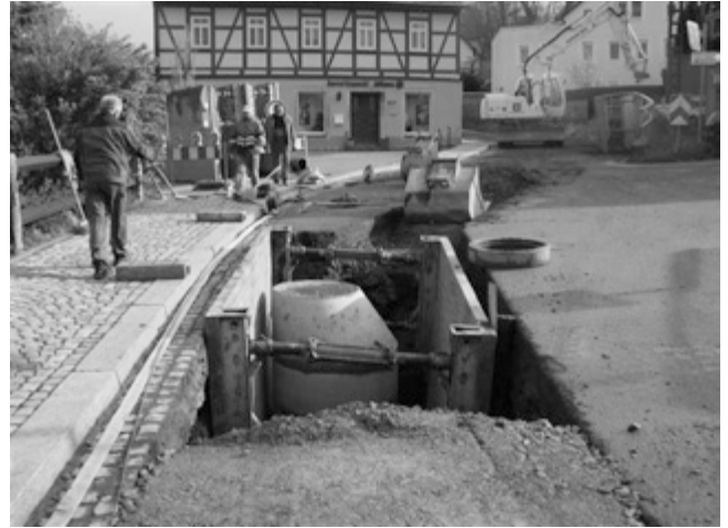
Kanalbau Canzlerstraße, 12.05.2010

Bauarbeiten an den Straßen so zu gestalten, dass trotz der schwierigen Haushaltslage ein besserer Straßenzustand als vorher hergestellt werden kann und bestehende Schwierigkeiten, wie zum Beispiel in der Wasserableitung, mit zu beseitigen.