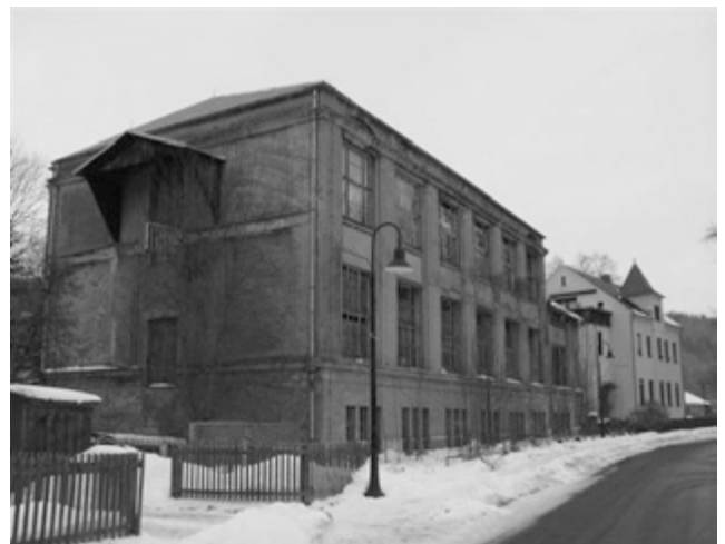
Bahnhofstraße 15, Ortsteil Meinersdorf

Nach dem Abbruch entsteht eine Grünfläche.