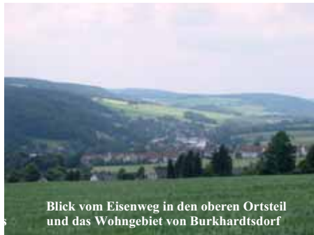
Blick vom Eisenweg in den oberen Ortsteil und das Wohngebiet von Burkhardtsdorf