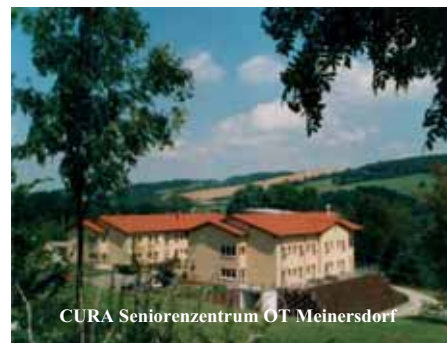
CURA Seniorenzentrum OT Meinersdorf