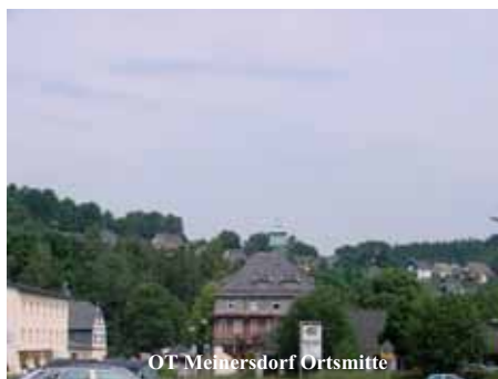
OT Meinersdorf Ortsmitte