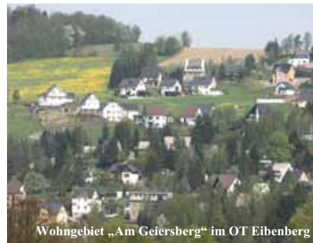
Wohngebiet „Am Geiersberg“ im OT Eibenberg