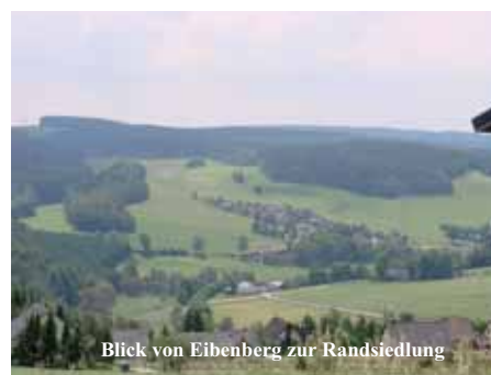
Blick von Eibenberg zur Randsiedlung