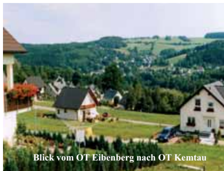
Blick vom OT Eibenberg nach OT Kemtau