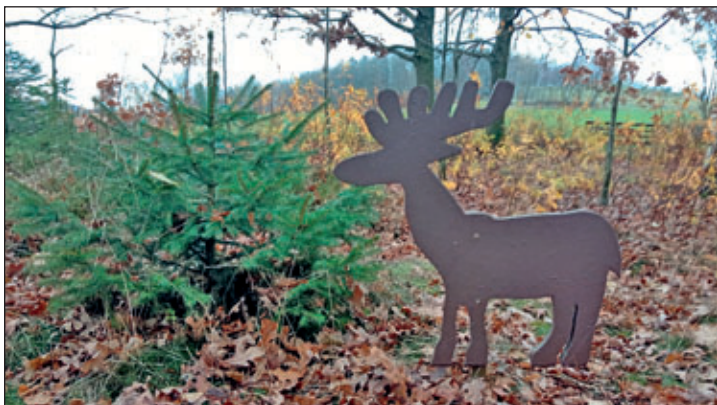
Eibenberger Park gestaltet durch Familie Förster