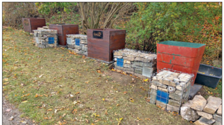
Gelenauer Straße gestaltet durch Familie Bock/Wagner

Natürlich würden wir uns auch 2021 sehr freuen, wenn diese Beispiele Schule machen und sich noch mehr Bürger für die Verschönerung unseres Ortes engagieren.