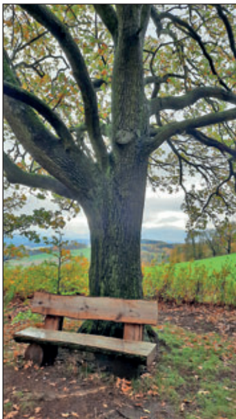
Eibenberger Park gestaltet durch Familie Förster

Im Ortsteil Kemtau ist es die Familie Bock/Wagner. Sie haben das Gemeindegrundstück an der Gelenauer Str. / Burkhardtsdorfer Str. sehr liebevoll gestaltet. Als Dankeschön wurde beiden Familien ein Gutschein überreicht.