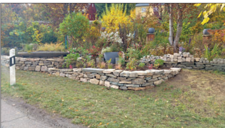
Gelenauer Straße gestaltet durch Familie Bock/Wagner