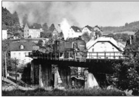
1976, Abbruch Schmalspurbahnstrecke in der Ortslage Gornsdorf

In Anerkennung ihrer vorbildlichen Arbeit im Rahmen der FDJ-Freundschaftsstafette und in Auswertung der gesamten Klubbätigkeit im Jahre 1975 wurden im Januar 1976 die Jugendclubs Meinersdorf, „Johannes Dieckmann“ Neuwürschnitz, Auerbach, der Stollberger Jugendfilmklub am Theater der Freundschaft sowie der Jugendklub Ursprung durch den Rat des Kreises Stollberg und die FDJ-Kreisleitung ausgezeichnet.