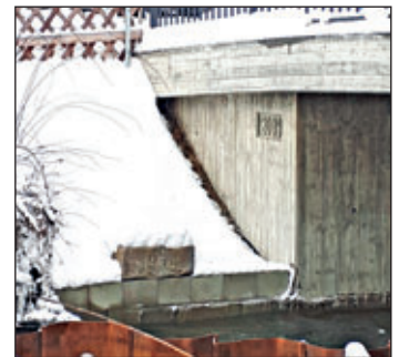
neue Brücke mit altem Stein, Zustand am 11.02.2021