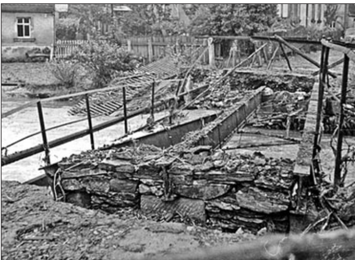
zerstörte Brücke an der Alten Poststraße 1954

Neben dem E-Werk querte die Alte Poststraße mittels einer Brücke den Fluss. Diese Brücke wurde durch die Fluten vollkommen zerstört. Das Ausmaß der Zerstörung wurde erst nach dem Fallen des Pegels sichtbar.