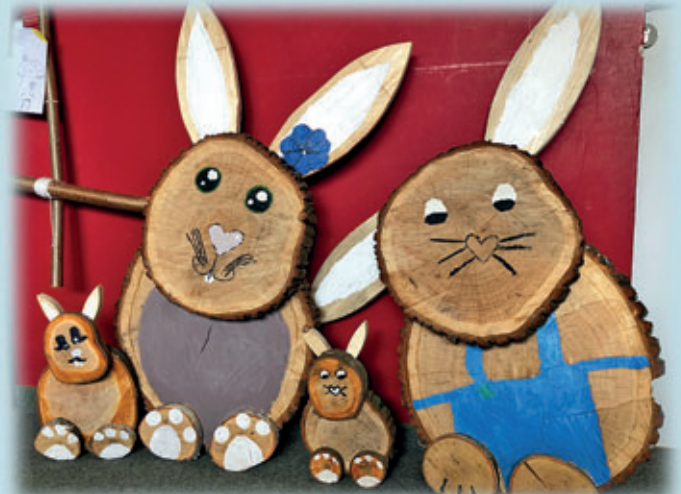
bemalt von Klasse 4