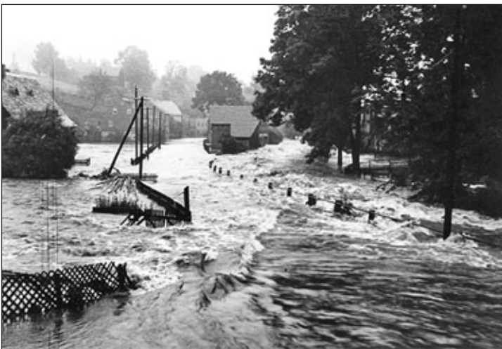
Hochwasser in Höhe des heutigen Edeka-Marktes

Anfang Juli 1954 wurde auf der Vorderseite eines Tiefdruckgebietes feuchte, warme Mittelmeerluft auf unser Gebiet gelenkt. Von Norden her kam kalte Polarluft. An der Grenze dieser beiden Luftmassen kam es zu starken Niederschlägen. Diese wurden durch den Stau am Erzgebirge noch verstärkt. Auch in Burkhardtsdorf stieg die Zwönitz immer höher. Mein Onkel wohnte damals im E-Werk, also unmittelbar am Flusslauf. Noch bevor die Zwönitz über die Ufer trat, begab sich die Familie meines Onkels zu meinen Großeltern in die höher gelegene sichere Siedlung. Kurze Zeit später glich Burkhardtsdorf einer Seenlandschaft.