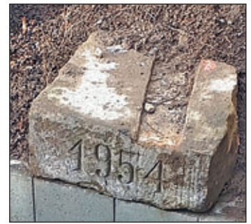
wiedergefundener Stein zum Hochwasser 1954