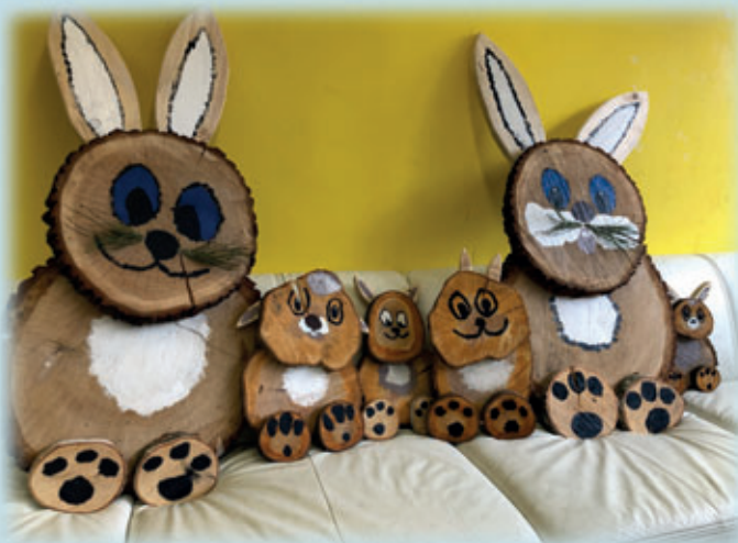
bemalt von Klasse 3