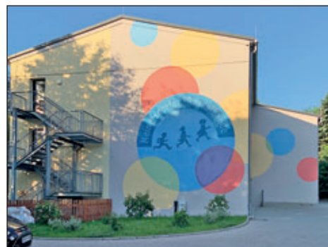
Kita „Meinersdorfer Rasselbande“; Ortsteil Meinersdorf

Nachfolgend möchte ich gern auch noch die Erhöhungen der Entgelte für die Einrichtungen Freibad und Bibliotheken begründen.