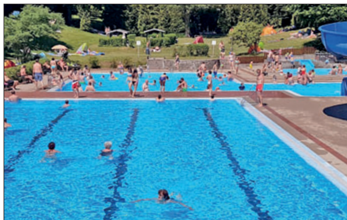
gut besuchtes Freibad Burkhardtsdorf

Bei den Bibliotheken haben wir ebenfalls eine Erhöhung der Entgelte beschlossen.