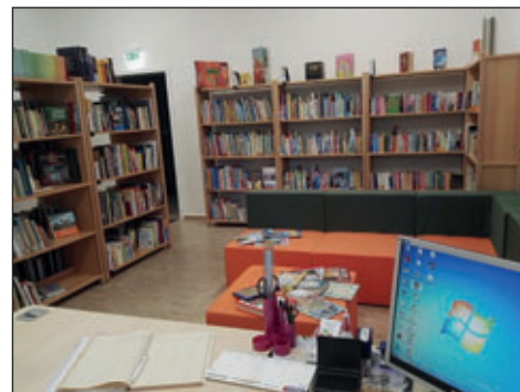
Bibliothek Meinersdorf Bereich Kinder- und Jugendliteratur