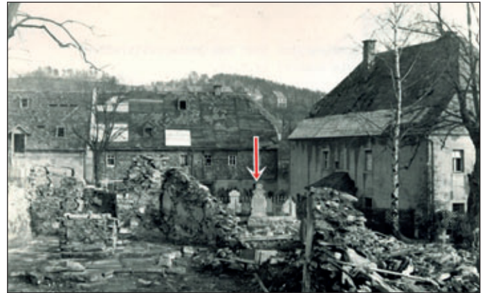
Standort des Grabsteines Februar 1945