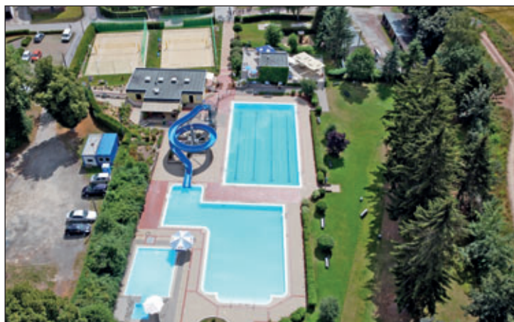
Ansicht von oben

Für die gebotene Qualität unseres Freibades und dem Konsens im Gemeinderat, dass die jetzt beschlossenen Eintrittspreise für mindestens die nächsten drei Jahre stabil bleiben, ist diese Erhöhung aus meiner Sicht und auch für die finanzielle Situation unserer Gemeinde vertretbar.