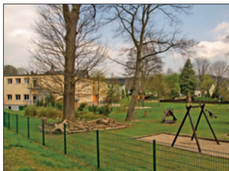
Kita „Mühlbergzwerge“; Ortsteil Burkhardtsdorf

Liebe Eltern, ich hoffe ich konnte bei Ihnen zumindest etwas Verständnis für die beschlossenen Erhöhungen der Elternbeiträge erzielen und die Zusammensetzung der Kosten und deren Auswirkungen etwas verständlicher darstellen.