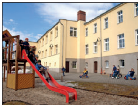
Kita „Löwenzahn“, Ortsteil Eibenberg