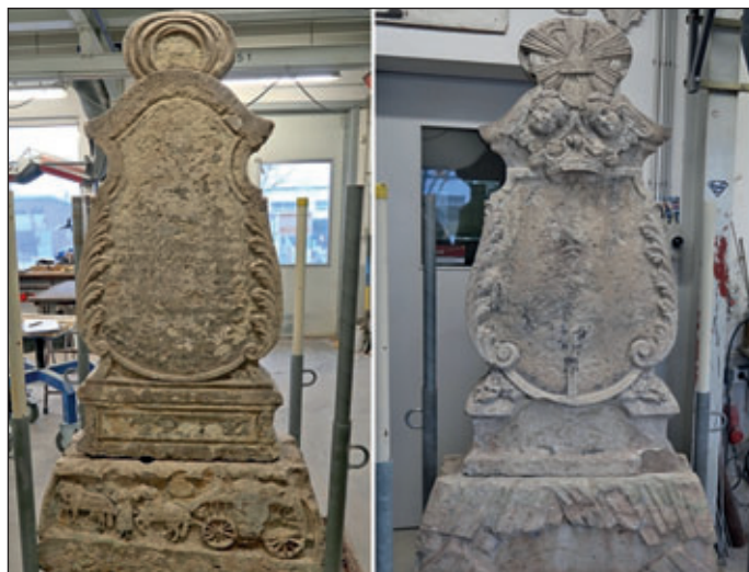
Zustand des Grabsteins am 23.03.2021, links Rückseite, rechts Vorderseite

Die Stadt Chemnitz zeigte Interesse an diesem Stein und so kam es zu einem zehnjährigen Leihvertrag zwischen der Ev.-Luth. Kirchgemeinde Burkhardtsdorf und dem Schloßbergmuseum Chemnitz. Er wurde im