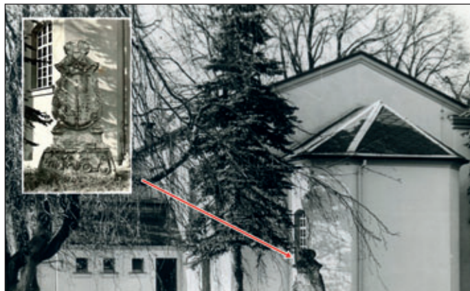
Grabstein etwa 1970