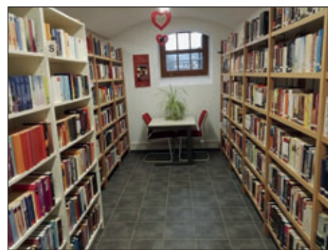
Bibliothek Burkhardtsdorf Bereich Belletristik