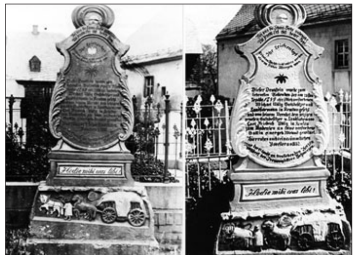
Zustand vor (links) und nach (rechts) der Restaurierung etwa 1920