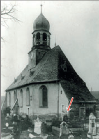
ursprünglicher Standort an der Ostseite der St. Michaelskirche, Aufnahme von 1938

Die Spurensuche nach alten Burkhardtsdorfer Steinen geht weiter. Heute begeben wir uns auf den Friedhof.