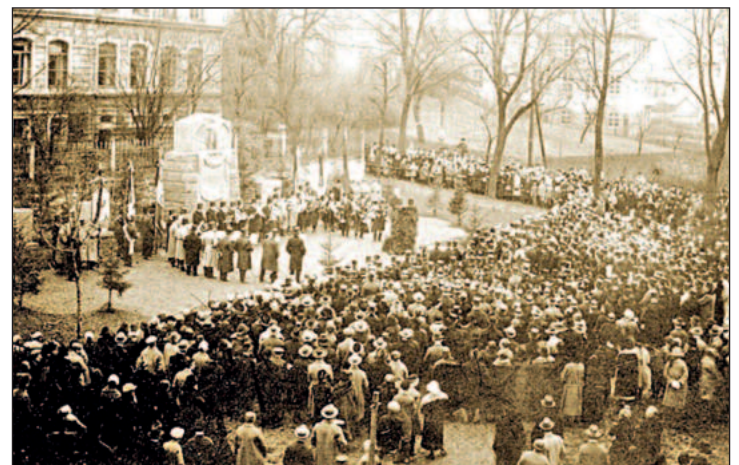
Einweihungsfeierlichkeiten am 22.11.1925

Am 22.11.1925, dem Totensonntag, wurde dieses Denkmal feierlich ein-