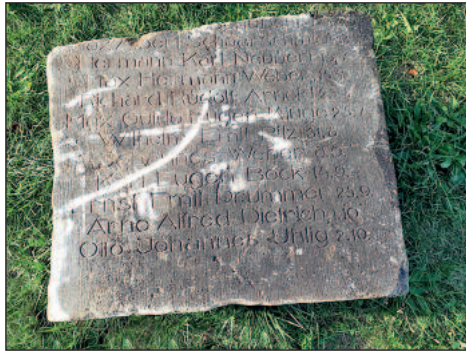
wieder aufgefundenes Bruchstück der Namensstafel

zieren hübsche Blumen das Areal. Das „Fundstück“ wurde jedoch noch nicht mit integriert. Möglicherweise hofft man auf weitere Teile der Namensstafeln.