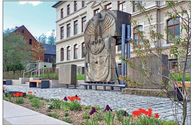
neu gestalteter Schulvorplatz mit Kriegerdenkmal 2021

Recherchen und Text: Falk Drechsel, Sehmatla-Cranzahl, Martina Hünlein Burkhardtsdorf