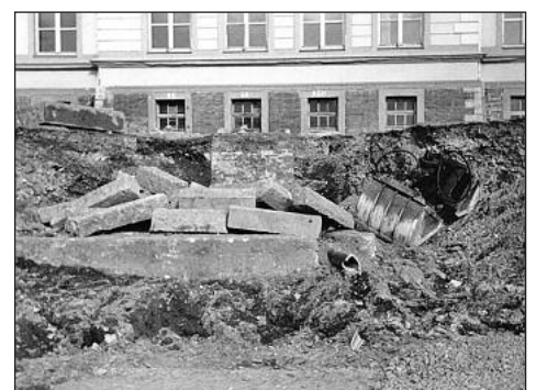
Bruchstücke beim Auffinden des Denkmals 1994