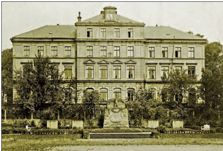
Ansicht des Kriegerdenkmales um 1925