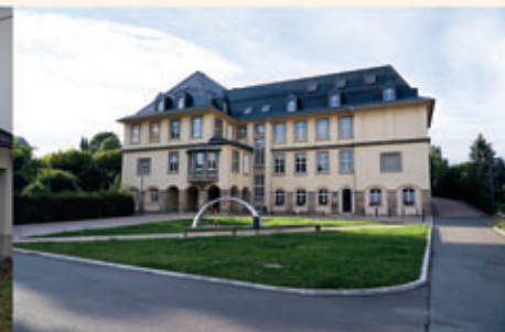
Bilder von links: 2x Regionalmanagement / Patrick Eichler