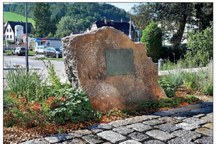
Gedenkstein im Jahre 2021