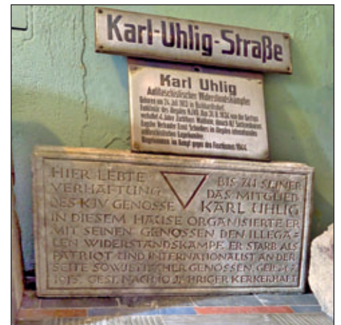
Gedenkstein vom Geburtshaus Karl Uhligs und ehemaliges Straßenschild mit Hinweistafel

lassung der Stein vor der Kurt-Richter-Schule wieder aufgestellt wurde, konnte leider nicht in Erfahrung gebracht werden. Aber auch dieser Standort war noch nicht endgültig. Bei der erneuten Umgestaltung der Anlagen im Jahre 2020 erhielt dieser Gedenkstein nunmehr seinen Platz links der neu erbauten Treppe auf der oberen Terrasse vor der Kurt-Richter-Schule.