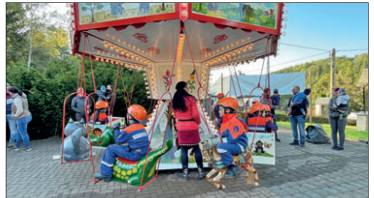
Die Jugendfeuerwehr Kemtau zeigt ihr Können bei einer Schauübung und die jungen Kameradinnen und Kameraden hatten auch viel Spaß beim Rummelbetrieb.