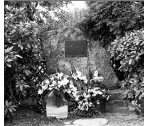
Gedenkstein vor der Lessingschule

Text Martina Hünlein, Arbeitsgruppe Ortschronik Burkhardtsdorf