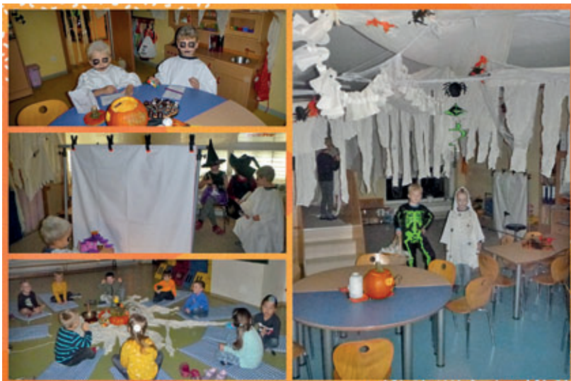
Das Team der Kita „Meinersdorfer Rasselbande“

In der letzten Oktoberwoche spukte es plötzlich in der Kita „Meinersdorfer Rasselbande“, denn unsere Vorschulgruppe hatte zum Gespensterfest eingeladen. Die Kinder brachten hierfür allerhand schaurige Dekorationen mit und so verwandelte sich das Gruppenzimmer der Frösche kurzerhand in ein Geisterschloss. Am Freitag wurde dann zum Teil in tollen Kostümen Gespensterfest gefeiert. Zur gruseligen Gespenstergeschichte brachten sich die Kinder zunächst mit einer Geistermassage in Stimmung, bevor es dann schaurige Schattenbilder zu erraten galt. Bei gruseligen Leckereien ließen es sich die kleinen Hexen und Gespenster gut gehen und feierten mit stimmungsvoller Musik ein schaurig schönes Fest.