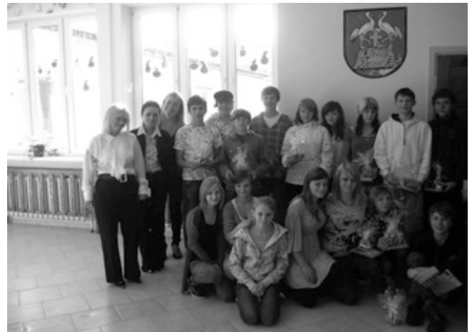
Abb. Abschied von Freunden

Mit Blick auf den Unterhaltungswert unseres Schüleraustausches könnte man formulieren: „Lieber ´ne Reise nach Polen als Fernsehen mit Bohlen“ oder „Ab in den Osten, als zu Hause zu rosten!“