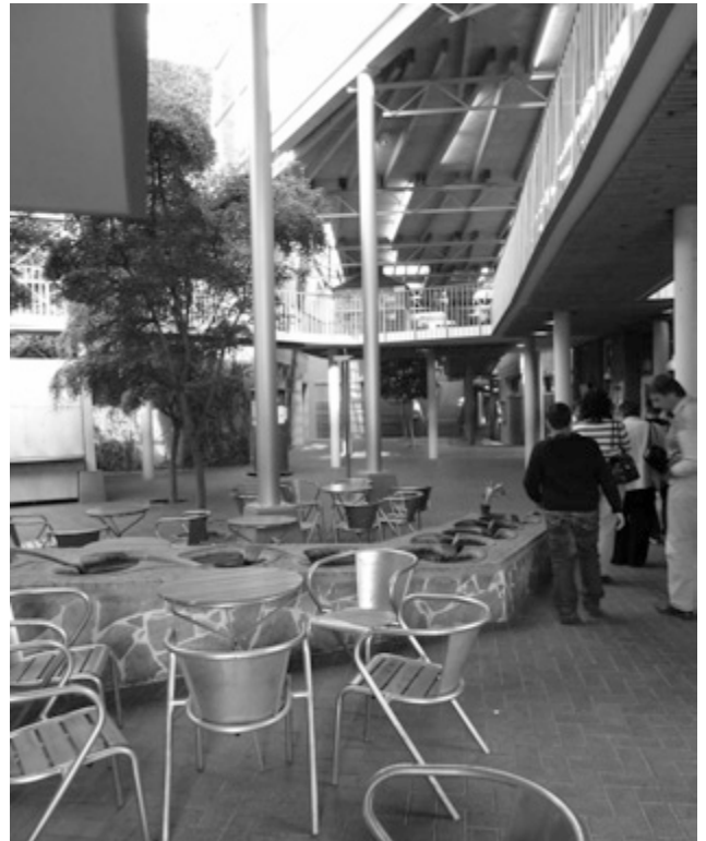
Abb. Begrünter Lichthof

anfangen Lebensräume statt Lehranstalten für unsere Kin-der entstehen zu lassen.