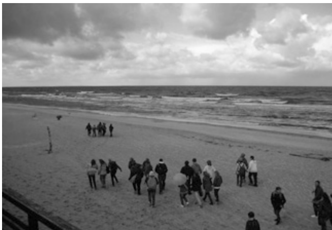
Abb. Für viele zum ersten Mal- Ostsee!