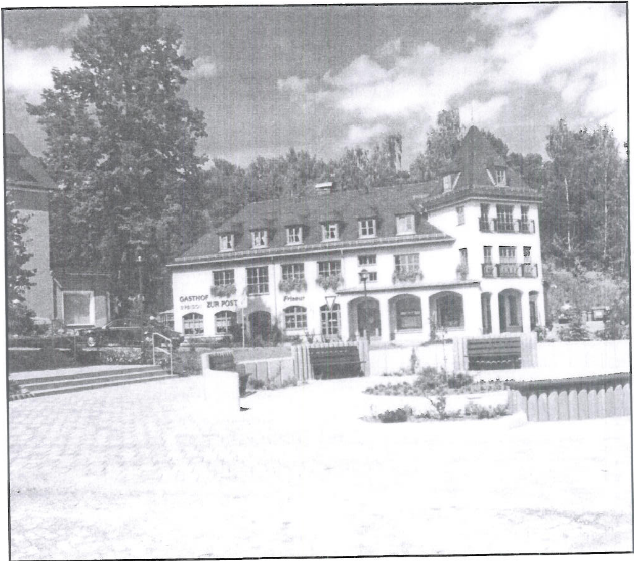
Bild vom neuen Markt mit Gasthof