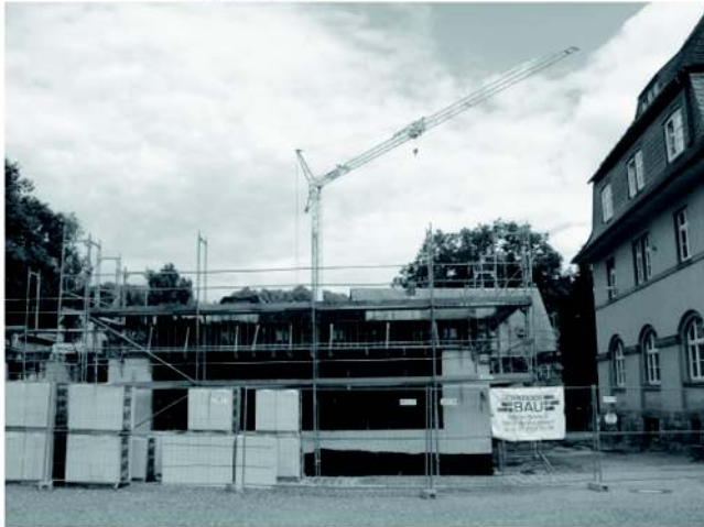
Blick vom Marktplatz auf die neue Schule, 08.08.2012

Neubau Zentrale Grundschule Burkhardtsdorf