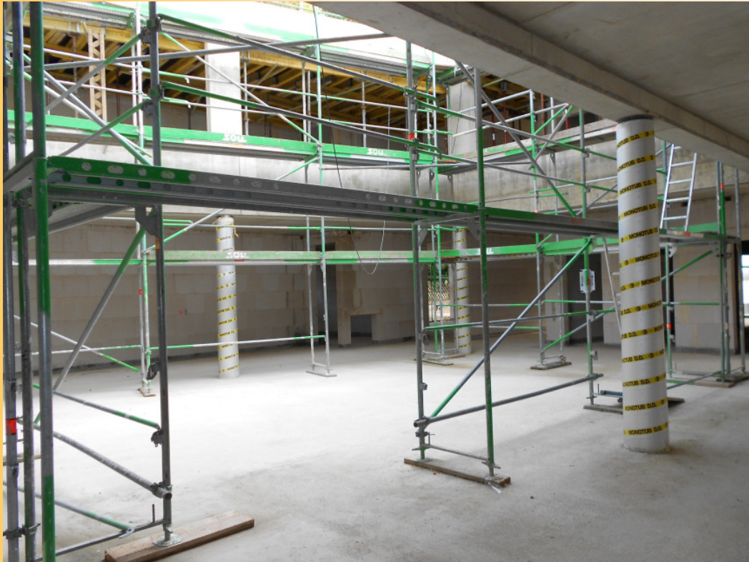
Blick ins Atrium (verglaster Sonnenhof)