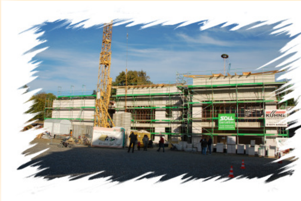
Vorderansicht des Schulgebäudes aus Sicht vom Marktplatz