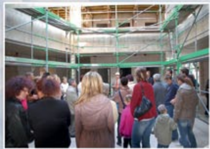
Zahlreiche Teilnehmer nehmen an den Führungen im neuen Gebäude der Grundschule teil.