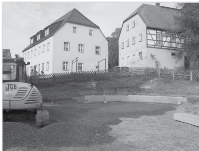
Blick vom Schulhof auf das Theatron, 10.10.2012

Die Betonteile für das Theatron wurden geliefert und werden nun zusammengesetzt. In der 42. Kalenderwoche soll es fertig sein. Danach folgen die Pflasterarbeiten des Schulhofs.