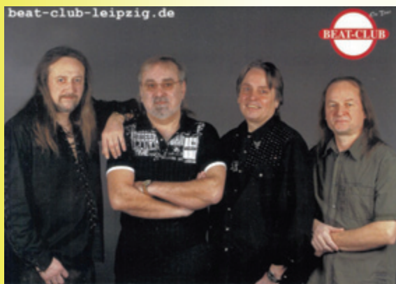
Beat Club Leipzig