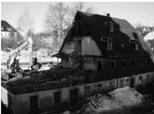
Baustelle Altes Gericht, Am Markt 6

Nach erfolgter beschränkter Ausschreibung erhielt die Firma Findeklee Baugesellschaft mbH, Alte Poststraße 15, 09235 Burkhardtsdorf den Auftrag zum Abbruch des Alten Gerichts, Am Markt 6 direkt neben dem Rathaus. Gefördert wird dieses Vorhaben durch das Bund-Länder-Programm Städtebauliche Sanierungs- und Entwicklungsmaßnahmen „Neue Ortsmitte Burkhardtsdorf“. Die Abbruchkosten betragen rund 57.000 € Ende Januar 2011 soll die Baumaßnahme abgeschlossen sein. Zukünftig soll an diesem Platz die neue Grundschule Burkhardtsdorf entstehen.