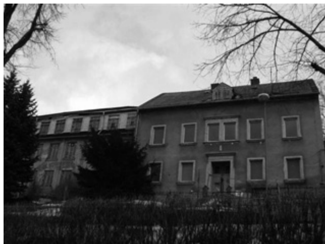
ehem. Nadelfabrik einschließlich Kontorgebäude

Wir möchten die Nachbarn der Unteren Hauptstraße 5/6 bereits heute um Ihr Verständnis bitten, da es bei Abbruchmaßnahmen trotz entsprechender Vorkehrungen immer zur Staub- und Lärmentwicklung kommt.