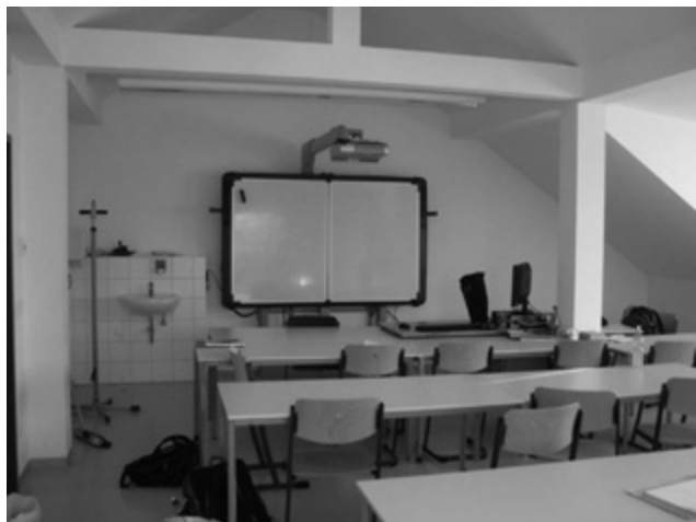
Activboard im Zimmer 10 der Kurt-Richter-Schule

Mitteln des Europäischen Fonds für regionale Entwicklung (EFRE) und des Freistaates Sachsen gefördert. „Da muss Lehren und Lernen unheimlich Spaß machen. Solche Bedingungen gibt es nicht einmal an unseren Hochschulen“, meinte unser Gast.