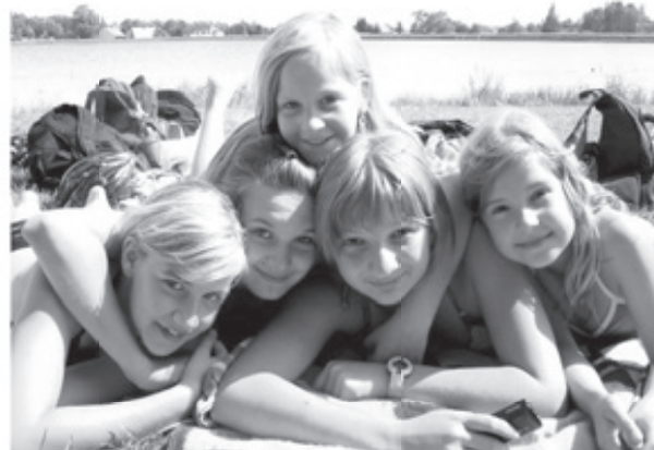
Dicke Freundschaften bei Ferienspaß – unvergesslich.

Informationen gibt es im Internet: www.gruene-schule-grenzenlos.de oder einfach anrufen unter 03732080170.