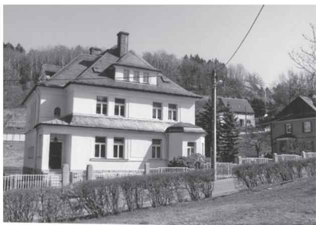
Kemtauer Flur 70, BK 29 D, Südweg 4

„Die Wohnhausvorderfront ist gleichlaufend zur Dorfstraße zu stellen und von der Straßengrenze mindestens 6 m abzurücken. Die nordwestliche Ecke des Wohnhauses von dem nördlichen, vorüberführenden Weg hat mindestens 7 m Abstand zu halten. Längs der beidseitigen Straßengrenze ist das Baugrundstück einzufriedigen und mit Vorgarten zu versehen. Bei späterer Straßenverbreiterung ist die Einfriedigung auf Kosten des jeweiligen Besitzers „zurückzusetzen.“. 1930 wurde das Villengrundstück auf einen Einheitswert von 25.500 RM geschätzt. 1940 verkaufte Hlawatys Witwe das gesamte Anwesen. Die nächste Zeit war es in Händen des Teehändlers Wilhelm Sehestedt, bekannt als „Teebude“, bis es 1947 Albert Reinhardt erwarb. Auch heute ist es noch im Besitz der Fam. Reinhardt und das WH steht unter Denkmalschutz.