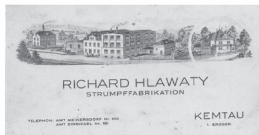
Kemtauer Flur 36b, BK 26c, Gelenauer Str. 7