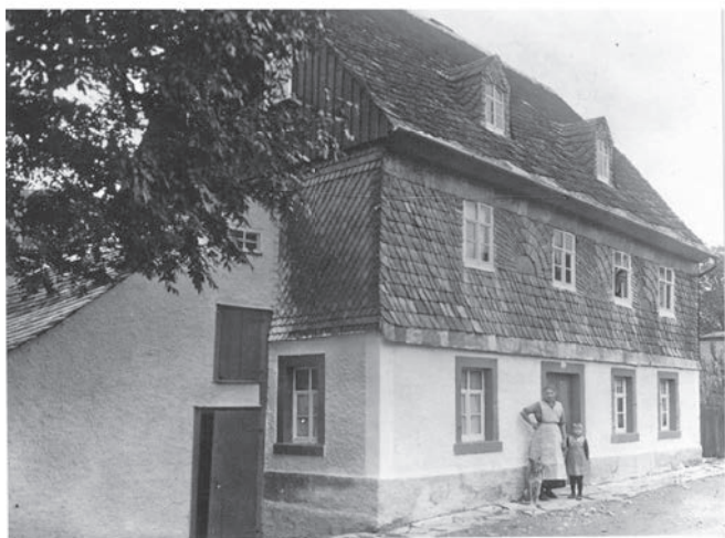
Kemtauer Flur 66, BK-Nr. 25, Südweg 3