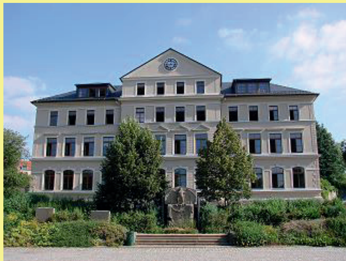
-Kurt Richter Schule-

zeigen Ergebnisse des Unterrichts, präsen- tieren moderne Kabi- nette, gestalten kultu- relle Höhepunkte, laden zu Speis' und Trank, begrüßen liebe Gäste, erwarten zukünftige Schüler und freuen uns auf den