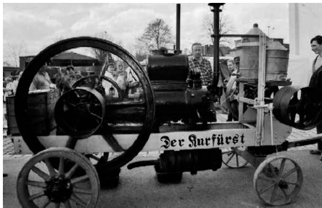
100 Jahre alte originale funktionstüchtige Dampfwalze

Unser 100-jähriges Geburtstagskind wird natürlich auch selber noch in Aktion treten und u.a. einen Schmiedehammer und einen Generator antreiben. Der entstehende Gleichstrom wird gleich zum Antrieb einer fast ebenso alten Fuchsschwanzsäge genutzt. Auch die Stationärmotoren-Fraktion wird diesmal noch stärker vertreten sein. Es haben sich schon viele Aussteller aus ganz Deutschland angemeldet.