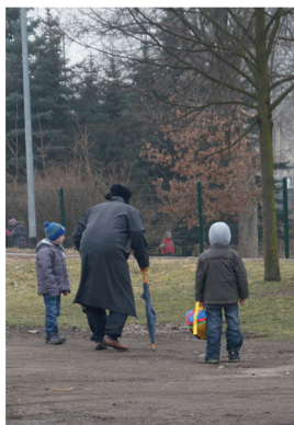
nachgestellte Situation - Klasse 1