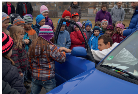
nachgestellte Situation – Kinder werden von einem Autofahrer angesprochen, Klasse 1 und 2