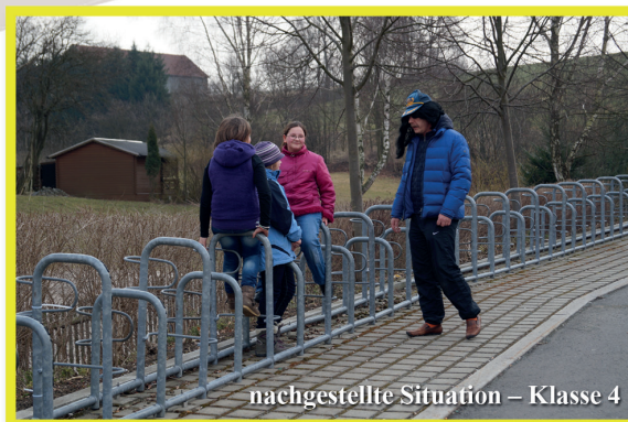
nachgestellte Situation – Klasse 4