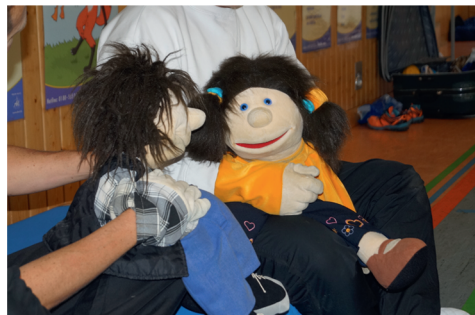
Rollenspiele mit den Handpuppen Felix und Lara