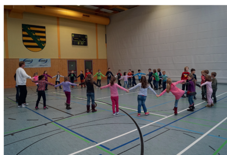
Mitmachen und Selbermachen war gefragt