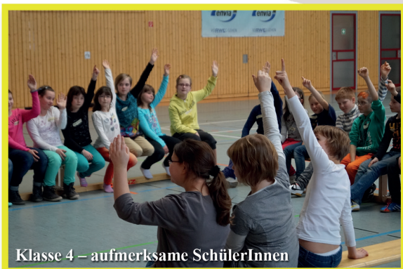
Klasse 4 – aufmerksame SchülerInnen

Weitere Informationen zur "Sicher-Stark-Initiative" finden Sie auf der Homepage www.sicher-stark.de Die Bildergalerien zu den einzelnen Trainingstagen der Klassen 1 – 4 finden Sie auf der Homepage www.burkhardtsdorf.de/Burkhardtsdorf/Ereignisse/2014 .