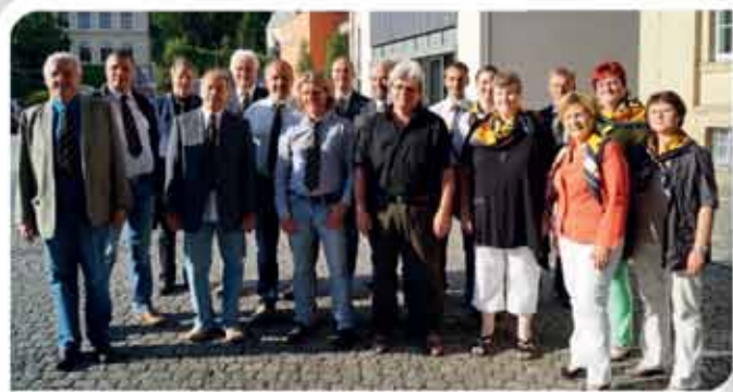
Verpflichtung der Gemeinderäte durch den Bürgermeister