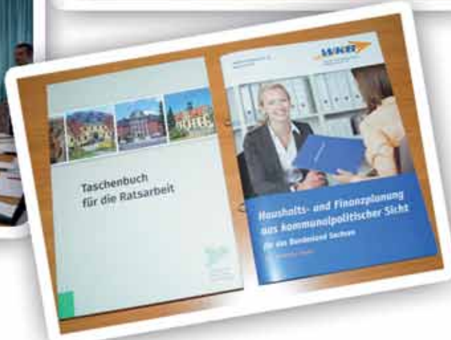
gesetzliche Grundlagen für die Arbeit des Gemeinderates