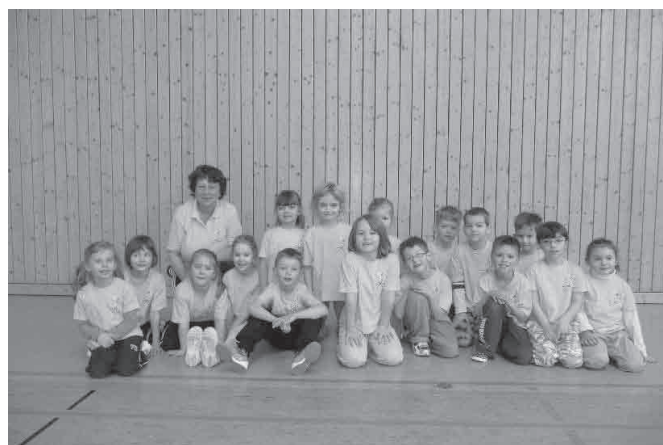
Kindertagesstätte „Löwenzahn“ Kemtau

Wir gratulieren und freuen uns von Herzen mit ihnen über den Sieg, zeigt es doch, dass die „Mühlbergzwerge“ nicht unbesiegbar sind.