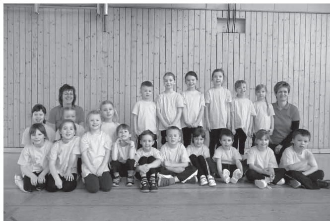
Kindertagesstätte „Mühlbergzwerge“ Burkhardtsdorf

Wir freuen uns nun schon auf das nächste Sportfest, welches am 24. März 2012 stattfinden wird. Es wäre schön, wenn wieder viele begeisterte Zuschauer die kleinen Sportler anfeuern und anspornen.