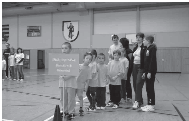
Kindertagesstätte „Rasselbande“ Meinersdorf