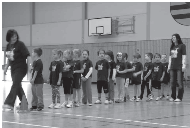
Kindertagesstätte „Tausendfüssler“ Gornsdorf