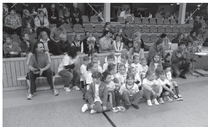
Kindertagesstätte „Gänseblümchen“ Auerbach

Den 3. Platz erkämpften die Auerbacher „Gänseblümchen“. Auch ihnen gelten unsere Glückwünsche.