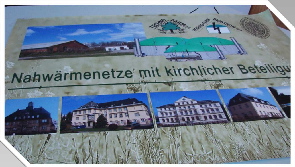
Foto links: Broschüre der Techno-Farm GbR zur Wärmeenergieerzeugung