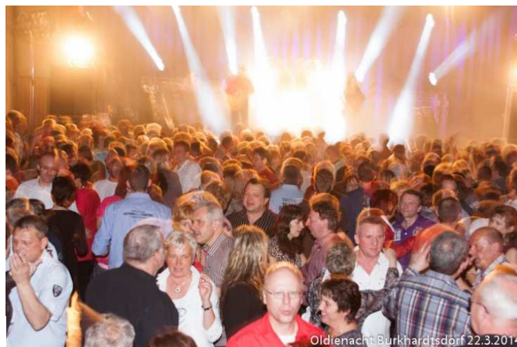
Oldienacht Burkhardttsdorf 22.3.2014