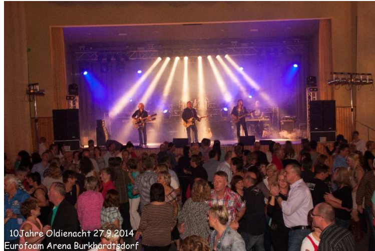
10 Jahre Oldienacht 27.9.2014 Eurofoam Arena Burkhardttsdorf