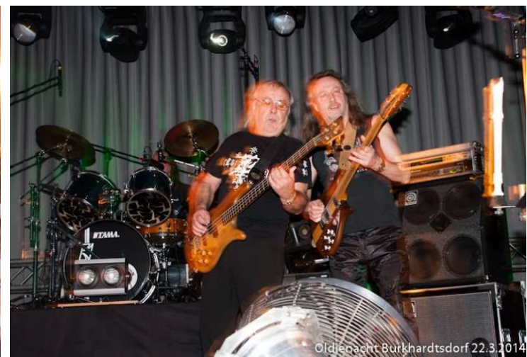
Oldienacht Burkhardttsdorf 22.3.2014