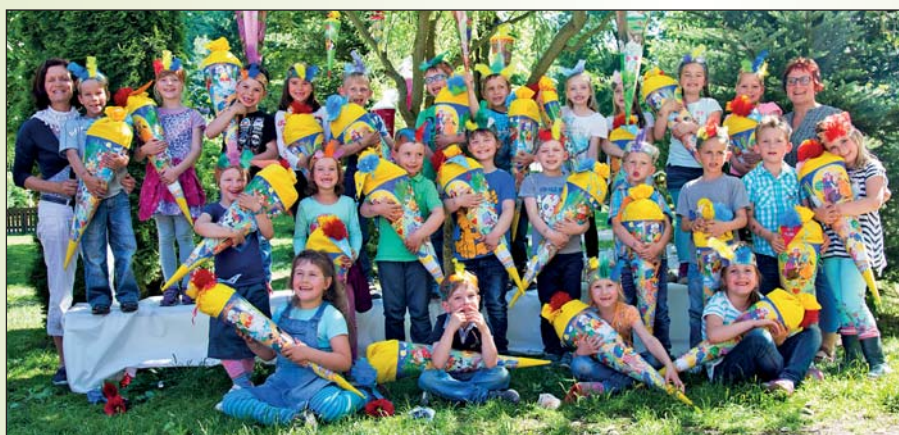
Schulanfänger 2016 der Kita „Mühlbergzwerge“ Burkhardtsdorf