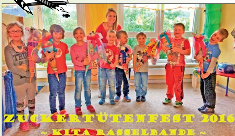
Schulanfänger 2016 der Kindertagesstätte „Rasselbande“ Meinersdorf