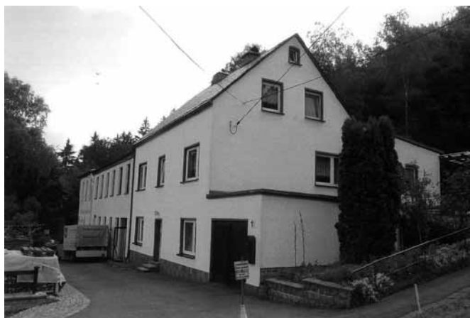
Nr. 22, Am Hang 1, Haus 28

Die Häuser befanden sich in sehr baufälligem Zustand. So gibt es viele Anschreiben an die Gemeinde mit der Bitte um Freistellung von der Mietzinssteuer. Er bekam folgende Antwort: „Rößler hat gewußt, in welchem Zustand sich die Häuser befanden. Er hat sie zu einem geringen Kaufpreis von 3000.- M erworben. Hinterhaus und Vorderhaus sind sehr baufällig. Im ersteren muß die eine Seite des Daches völlig erneuert werden. Auch sind die Dielen und die eine Giebelseite sehr reparaturbedürftig.“ In diesem Zustand war die Vermietung von 2 Wohnungen teilweise unmöglich. 1929 sind die Reparaturen abgeschlossen. Rößler musste mehrere Hypotheken aufnehmen und verkaufte deshalb auch Flur 53. Jetzt befinden sich auf Flur 54 drei Wohnhäuser der Fam. Rößler