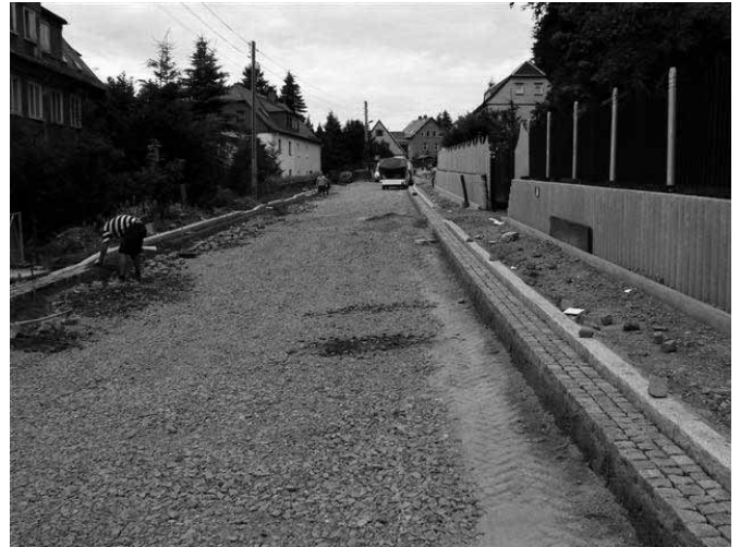
Straßenbauarbeiten B 180 13.07.2011

Ende Juli soll die Schwarzdecke aus Richtung Kemtau bis Höhe Eibenberger Straße 12 aufgezogen werden. Der Kanalbau des ZWW wird bis zum EDEKA- Markt fortgesetzt. Auch die neu errichteten Stützwände nehmen zusehend Gestalt an.