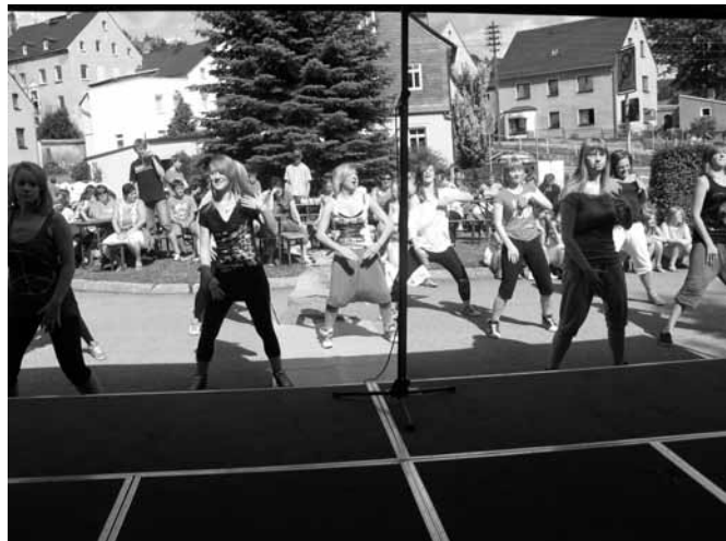
Move and groove – die Mädchen zeigten ihre Show!

Stolz präsentierten dann die Gruppen die Ergebnisse ihres Tuns auf dem Schulmarkt, wo es auch noch Grillwurst, Waffeln und Getränke gab. Ca. einhundert Gäste ließen sich dieses Spektakel nicht entgehen. Dass auch das Wetter mitspielte, machte diesen Abschlusstag zu einer gelungenen Veranstaltung.