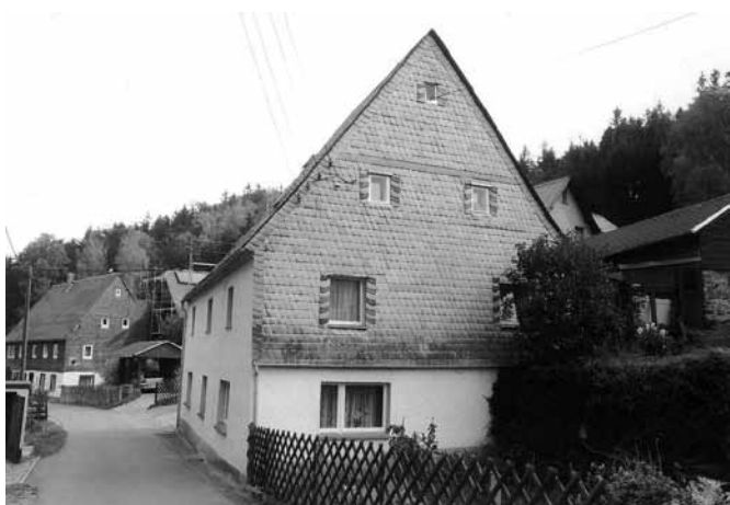
Haus Nr. 19, Am Hang