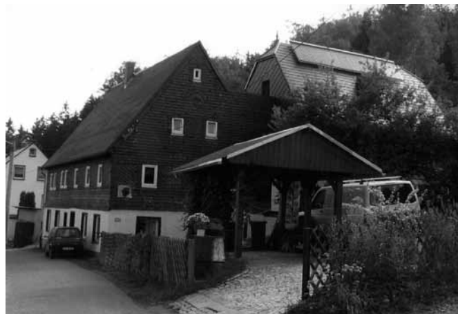
Haus Nr. 20/21, Am Hang 3 u. 3b