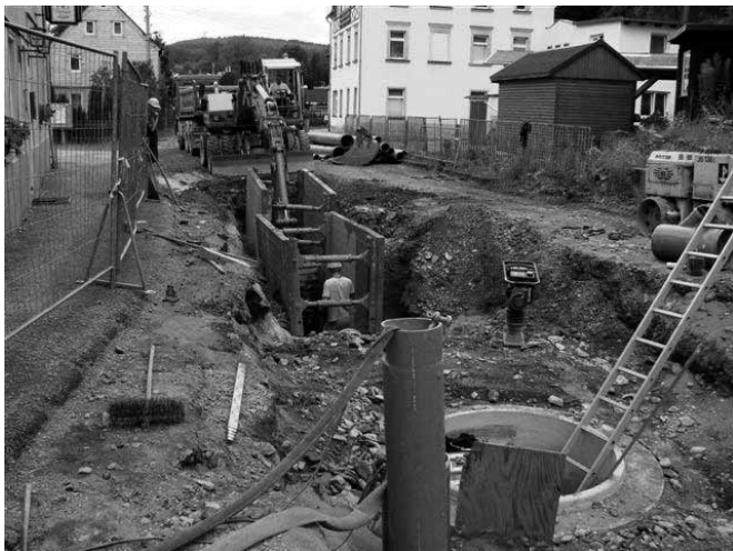
Kanalarbeiten B 180, 13.07.2011

Die Straßenbauarbeiten auf der Eibenberger Straße (B 180) haben mit dem Einbau der Frostschutzschicht begonnen und gehen zügig voran.