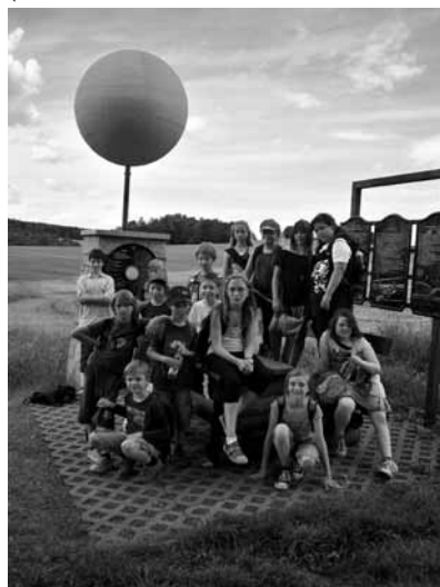
Auf dem Planetenwanderweg Ehrenfriedersdorf - Drebach

(Klasse 4 der Grundschule Burkhardtsdorf und Frau Meiner)