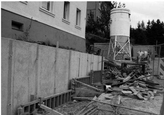
Errichtung Stützwand B 180, 13.07.2011

Die Straßenbauarbeiten auf der Eibenberger Straße (B 180) haben mit dem Einbau der Frostschutzschicht begonnen und gehen zügig voran.