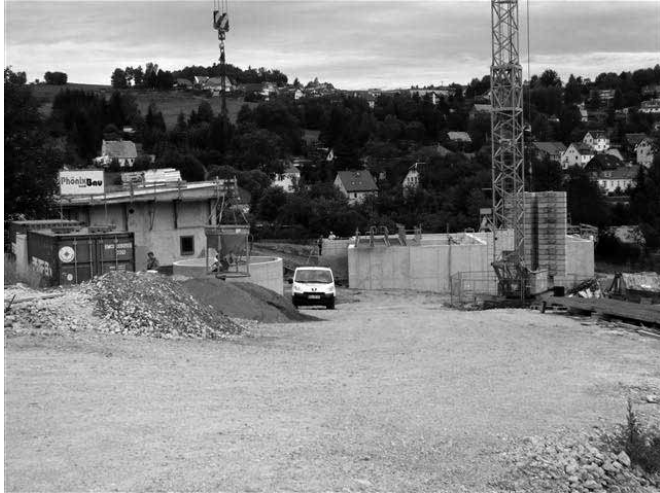
Kläranlage Burkhardtsdorf, 13.07.2011

Die Betonierarbeiten beim Neubau der Kläranlage Burkhardtsdorf sind weitestgehend abgeschlossen. Zurzeit erfolgt die Ausrüstung des Kompaktbeckens und des Betriebsgebäudes. Die Bauarbeiten liegen im Bauzeitenplan.