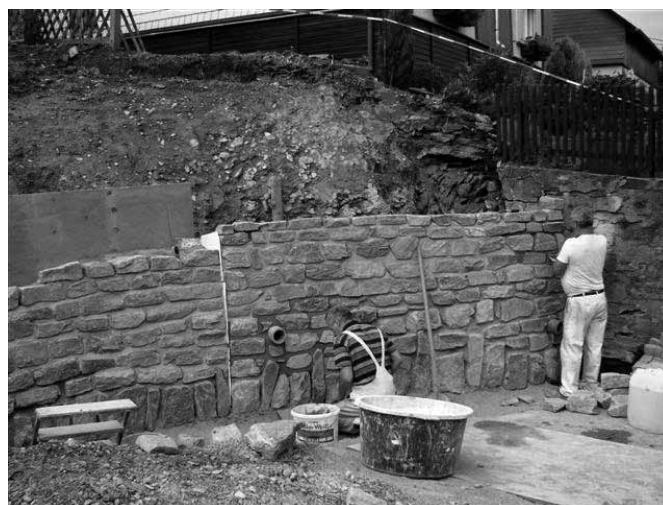
Errichtung der Stützwand, 13.07.2011

Die Arbeiten am Grundstück der ehem. Nadelfabrik, Untere Hauptstraße 5/6 gehen nach dem Abbruch dem Ende entgegen. Zurzeit läuft die Errichtung einer Stützwand zur Grundstückszufahrt. Ende Juli 2011 sollen die Tätigkeiten abgeschlossen sein.