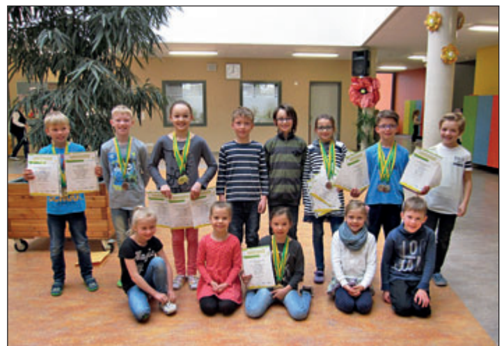
Sportlehrer der Grundschule