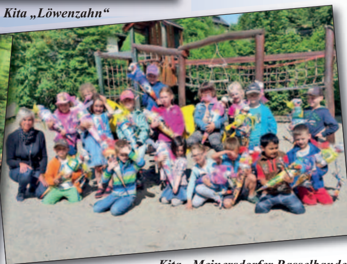
Kita „Meinersdorfer Rasselbande“