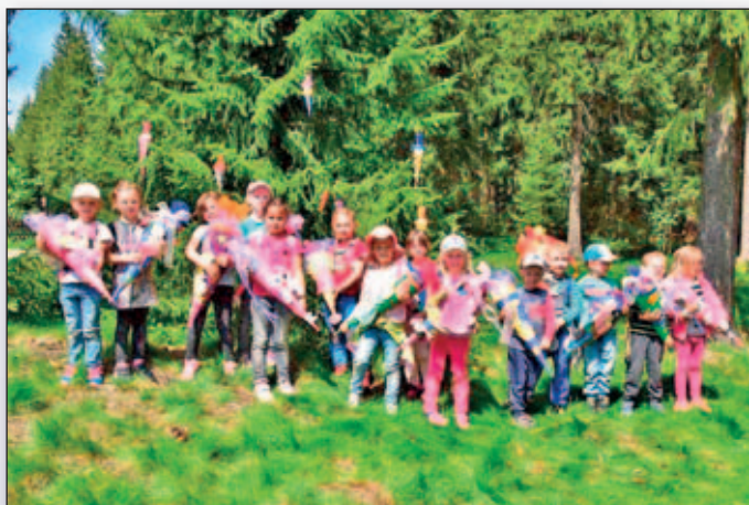
Kita „Löwenzahn“

Am 5. August 2017 ist Schulanfang Die Kinder unserer Kindereinrichtungen feiern fröhliche Zuckertütenfeste